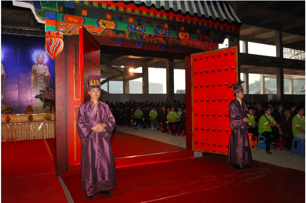
門拉開後於大門兩側站立 (9)