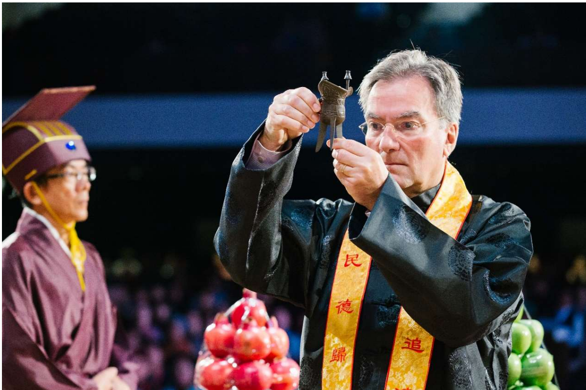
主祭官握爵行獻爵禮(15)