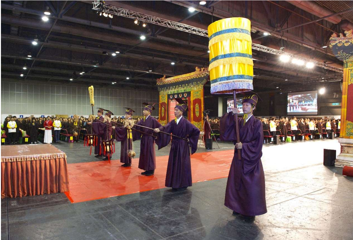
穿越側門，至門外自中至側排成一橫隊。(11)