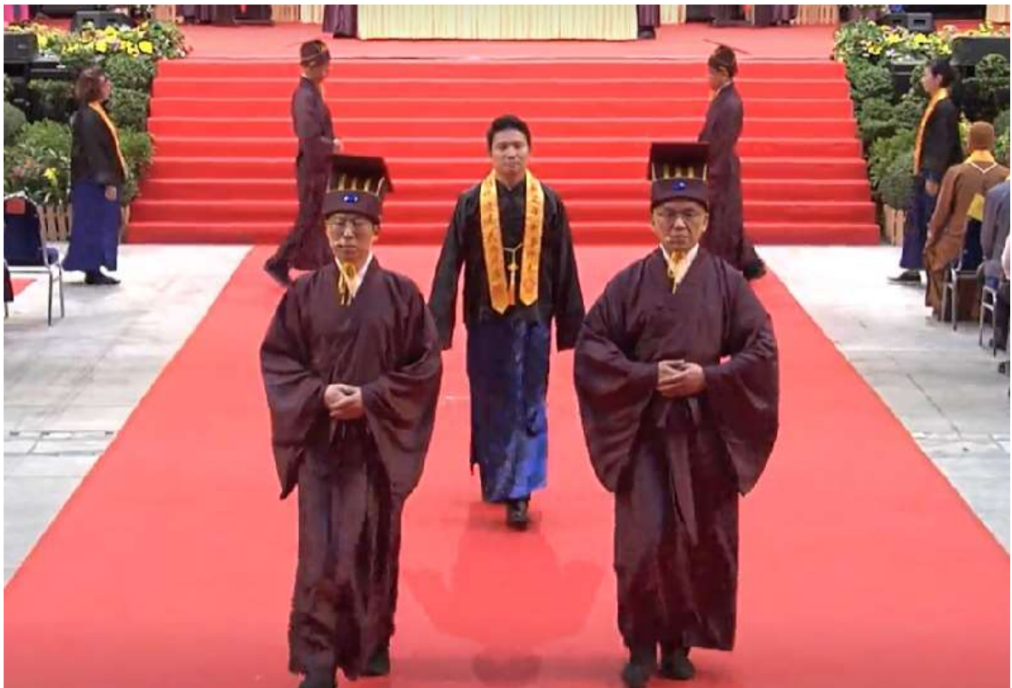
主祭官隨引贊向後轉，先行撤班。(28)