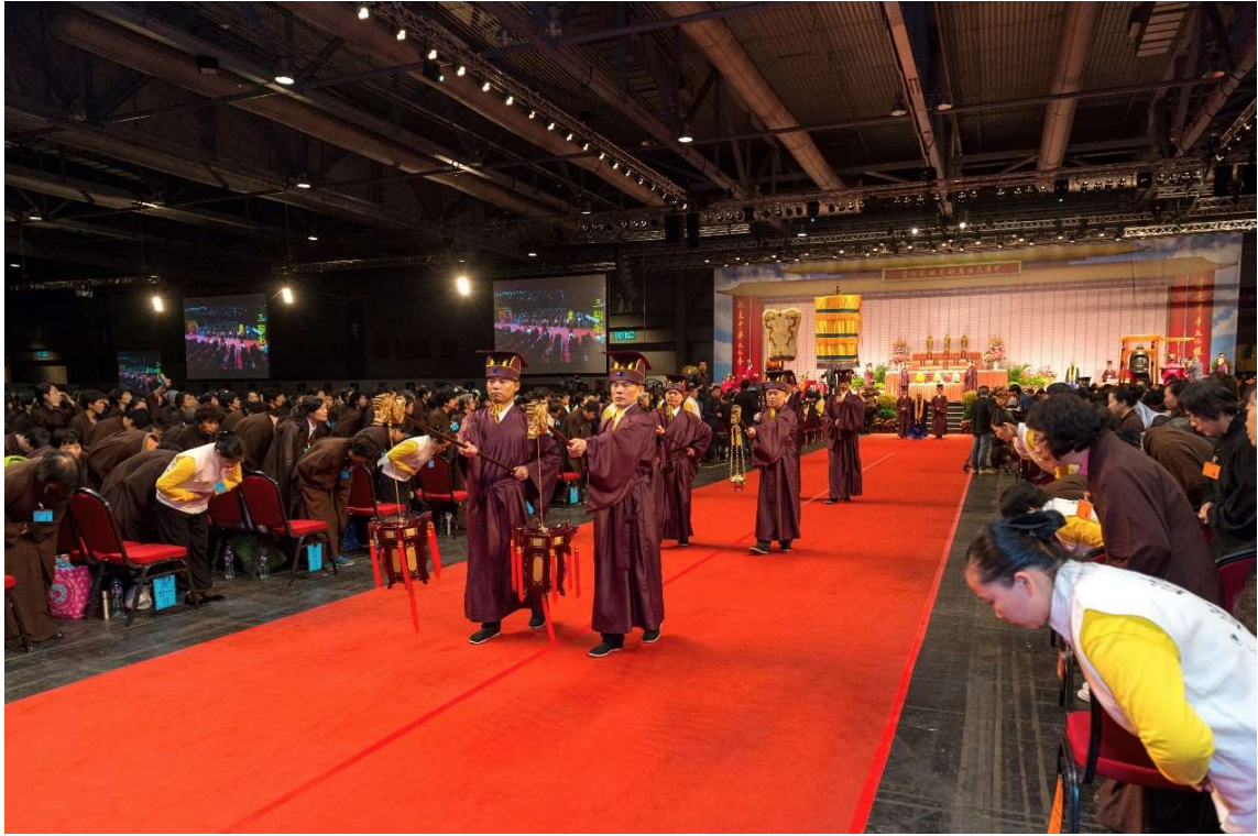
全體參禮者依序同時行禮 (23)