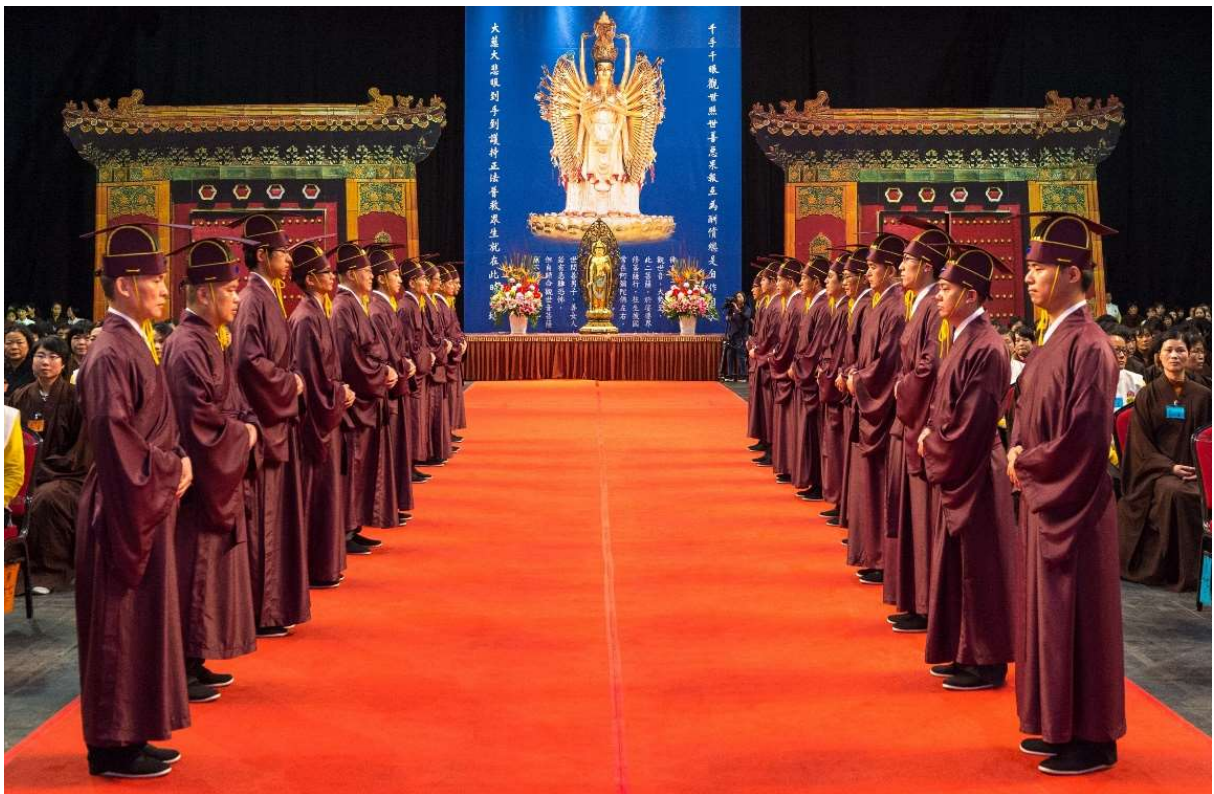
鼓聲一響全體禮生收左腳肅立 (5)