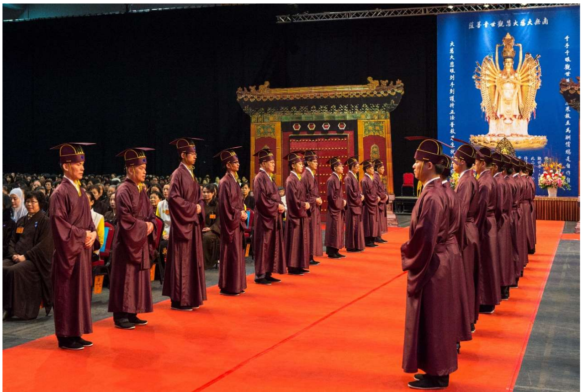
鼓聲三響，挺身而立。(28)