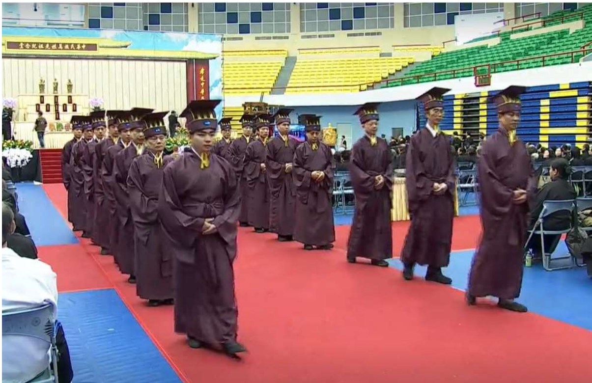
鼓再一響而終，禮生出左腳往外撤班。(25)