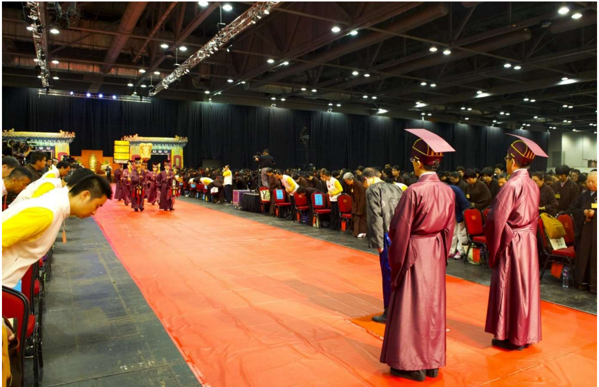
全體肅立面對迎神儀隊，行三鞠躬禮。(12)