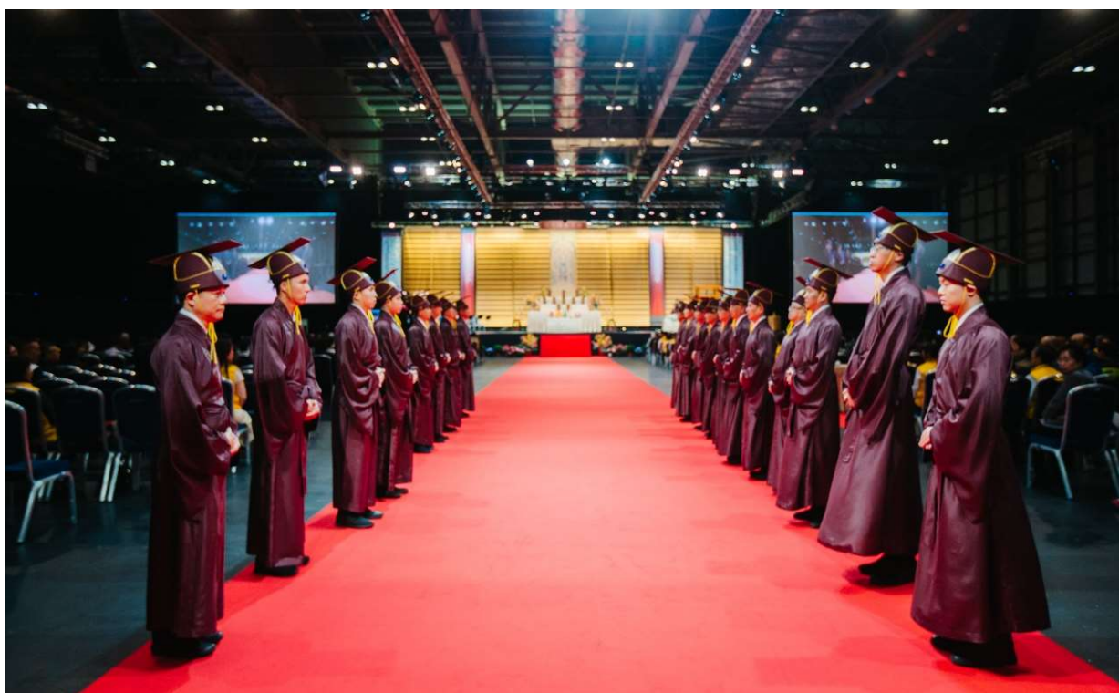
鼓聲第三響全體禮生挺身而立 (5)