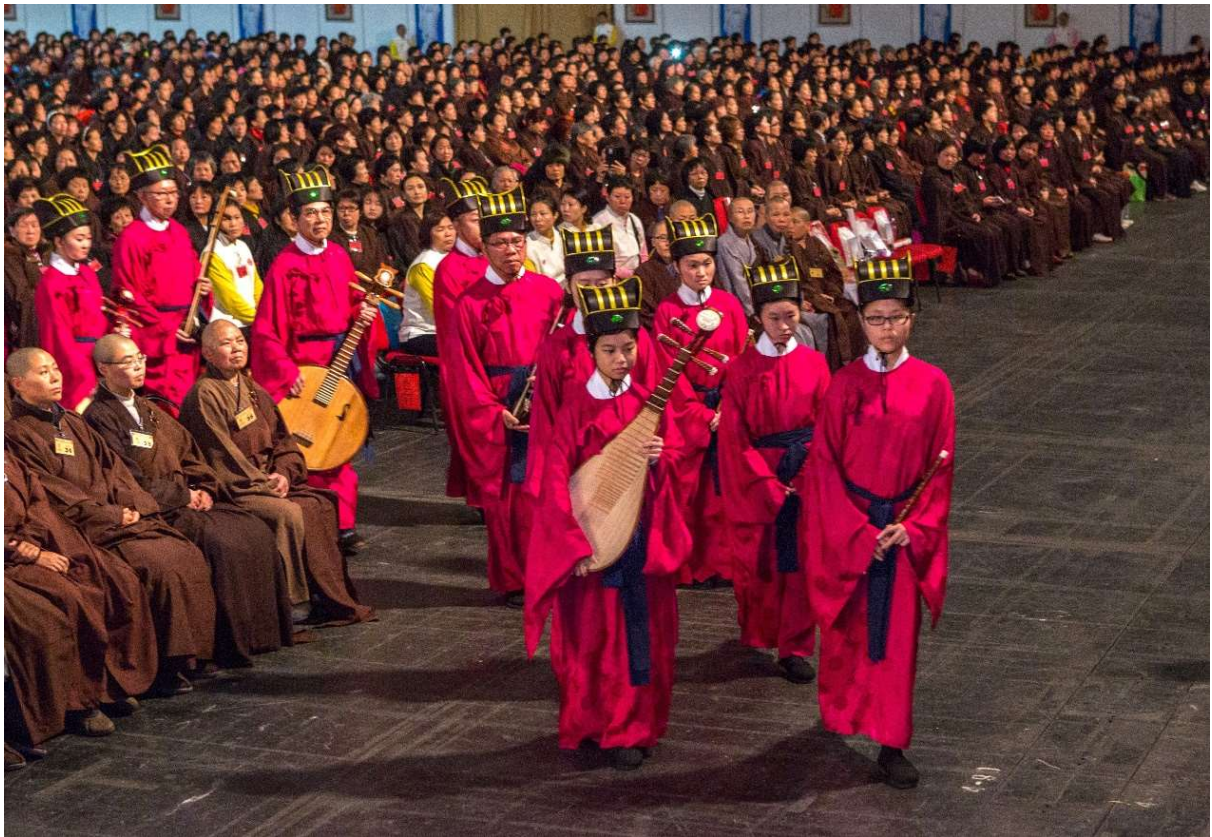
樂生配合鼓聲節奏出左腳一聲一步緩步就位（5）