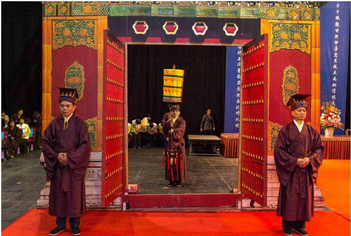
禮畢，向外轉身走至兩側門前，原地靜待隨主祭官進入復位。(22)