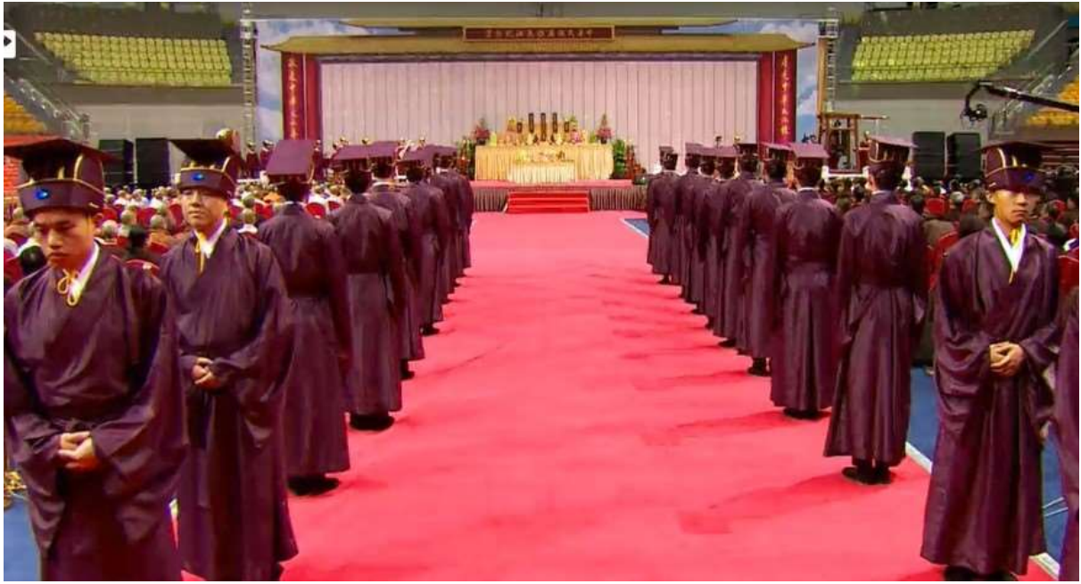
第四響時禮生依崗位方向左右轉，立正（5）