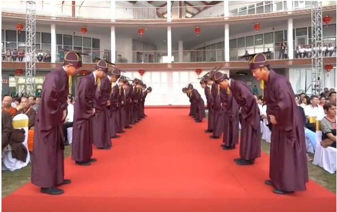
鼓聲再一響，禮生彎腰鞠躬。(28)