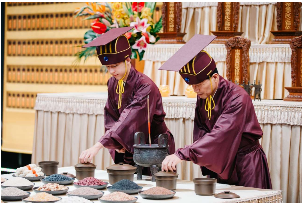
執事聞撤饌聲撤饌，撤畢，退回原位。(21)