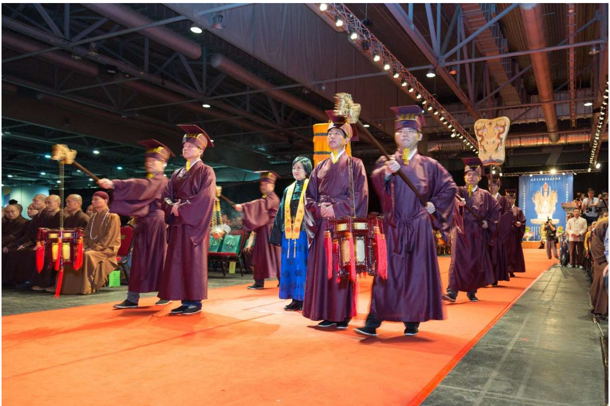
主祭官復位，送神儀隊隨主祭官分東西進入復位。(26)