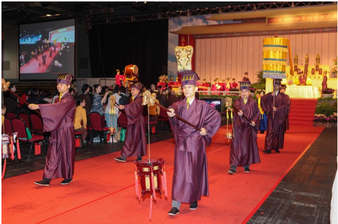
燈先導，爐、扇及繖隨後，相隔三至五步，沿通道兩邊出。(11)