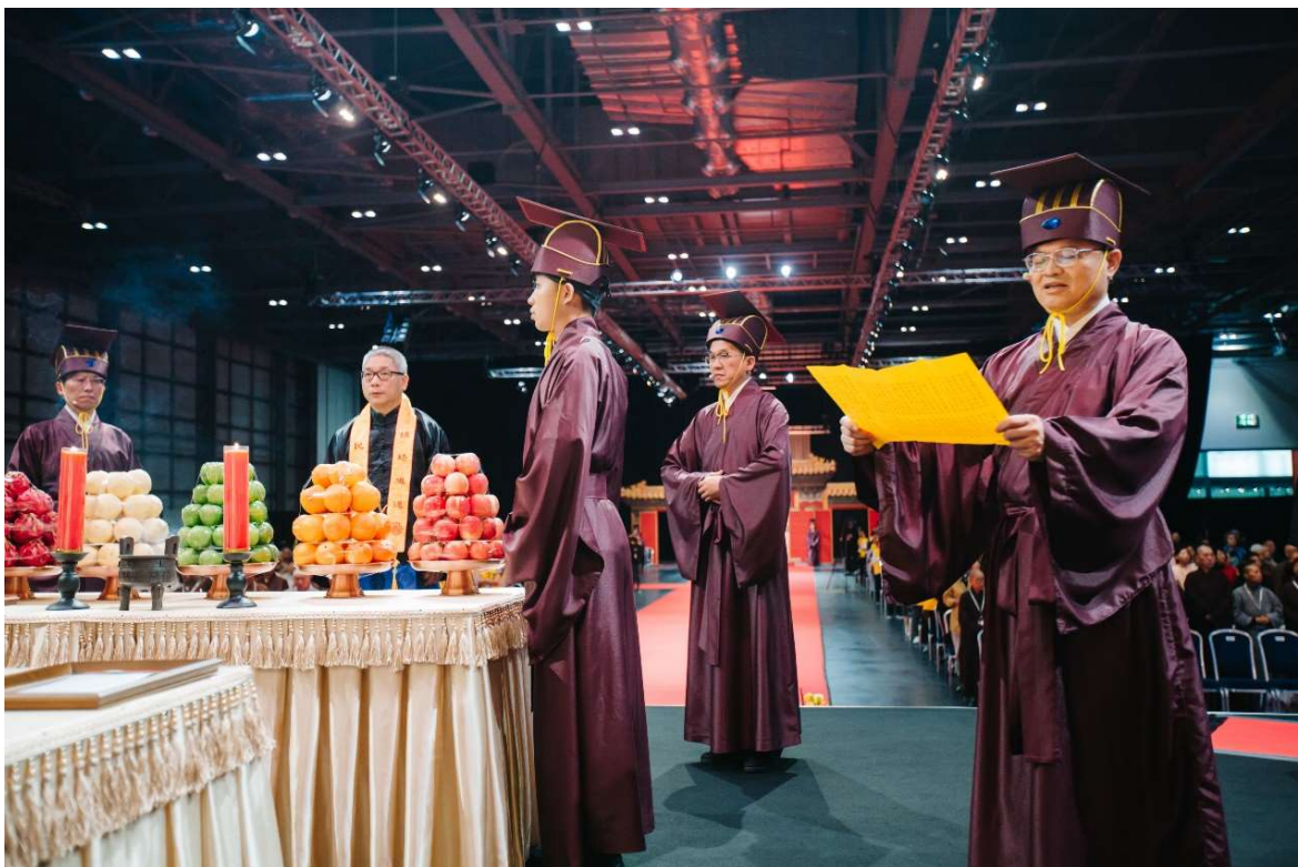
至供桌左禮生後轉身面對神位恭讀（16）