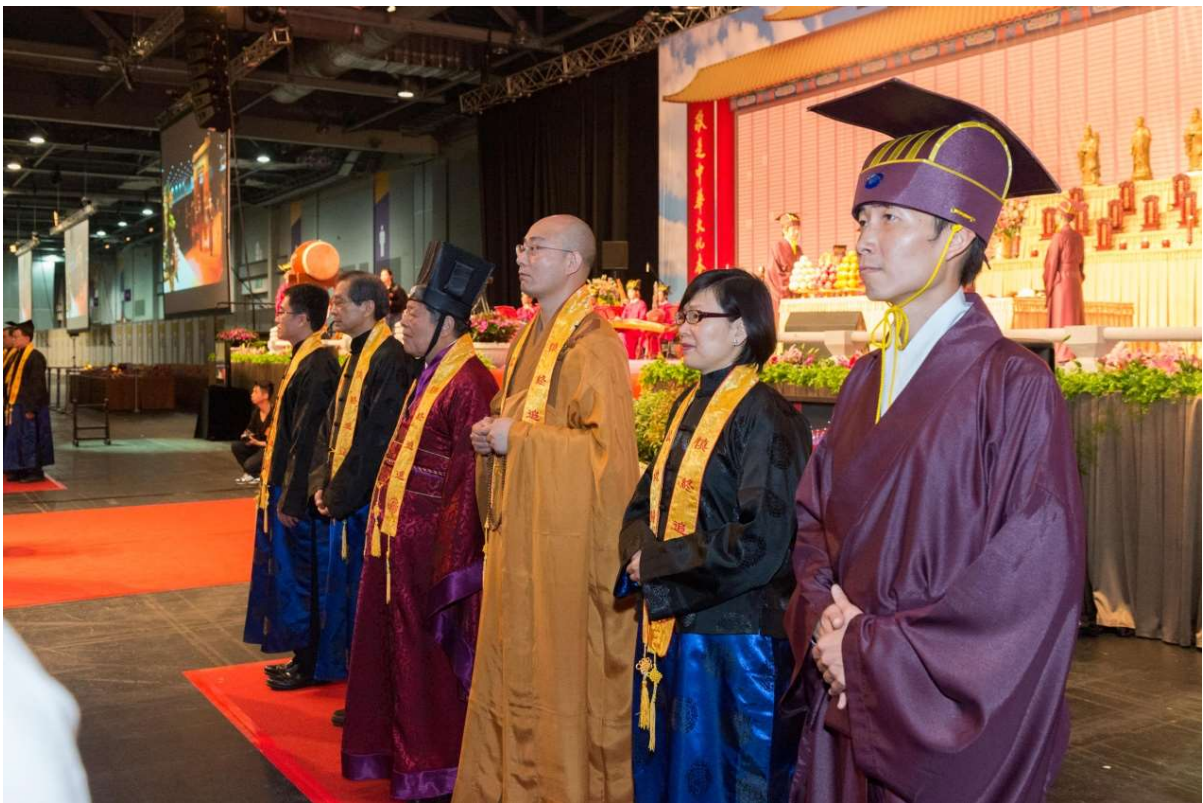
聞通贊唱望燎時，引贊輕聲通知各祭官向後轉，面對大門燎所。(25)