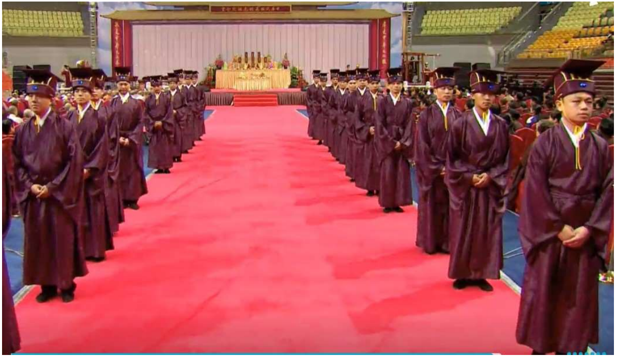
鼓聲四響，向大門左右轉身。(28)