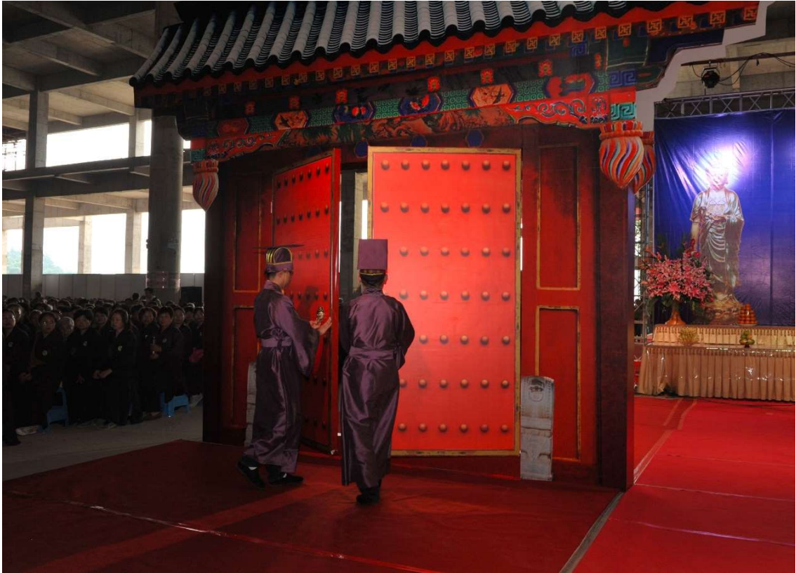
執事禮生雙手握門環一一關閉，闔扉後，退回大門兩側站立，靜待撤班。(27)