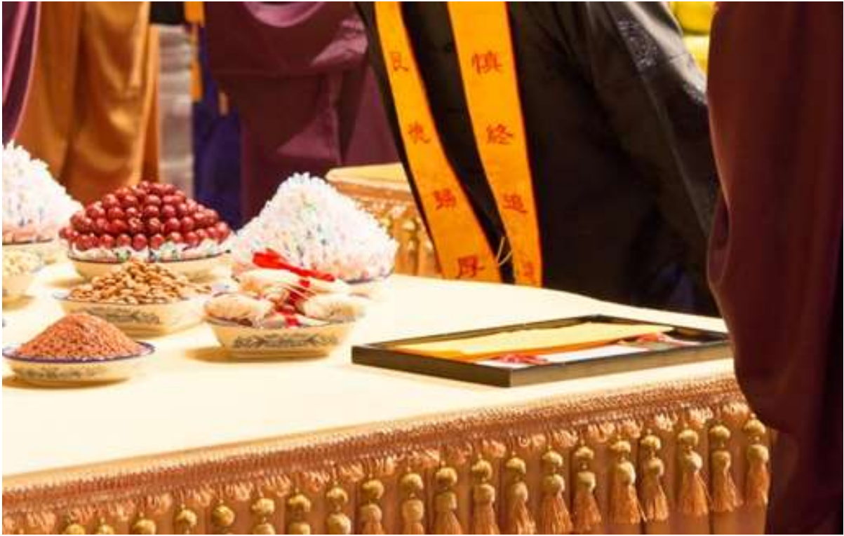
讀畢原地站立，聞通贊白「諸位請坐」時，文置帛上復位。(16)