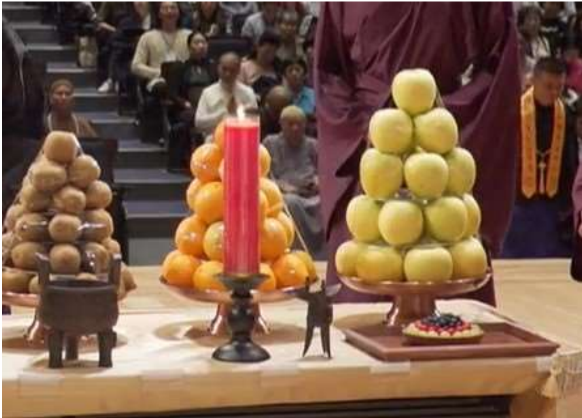
主祭官飲福受果後，福酒福果置香案左後方。(20)