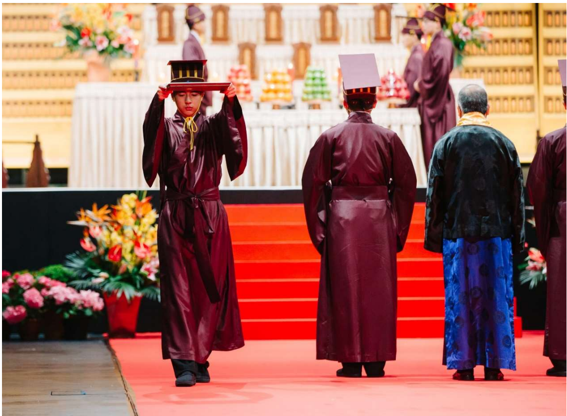
禮生肅穆虔敬捧祝帛至燎所焚化 (24)