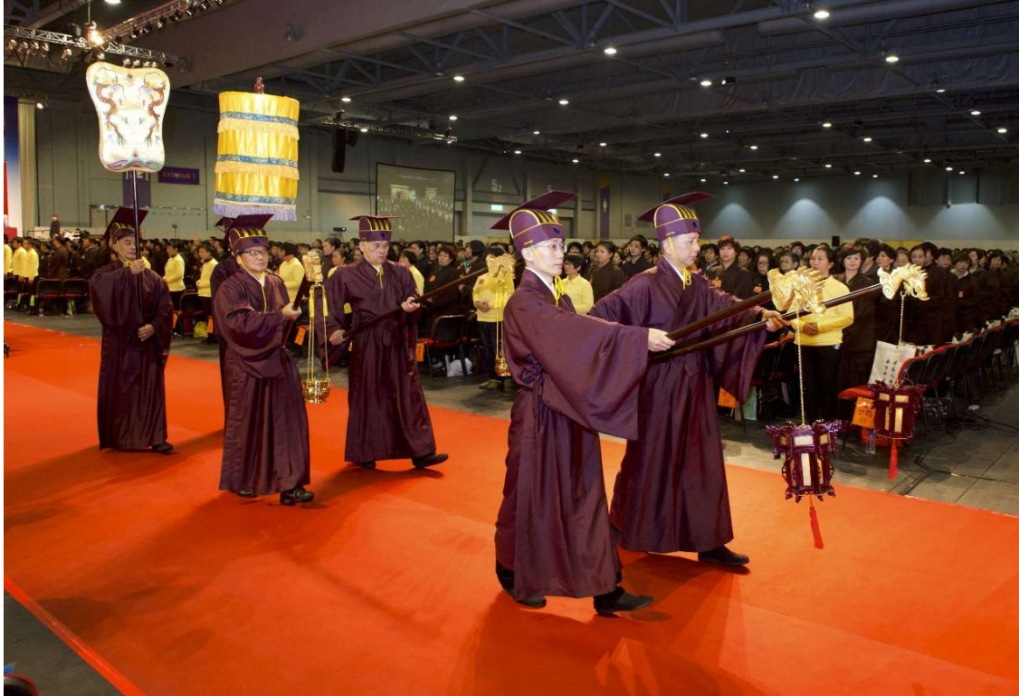
參禮者面向送神儀隊，以示「送神」，儀隊由通道中間出。(22)