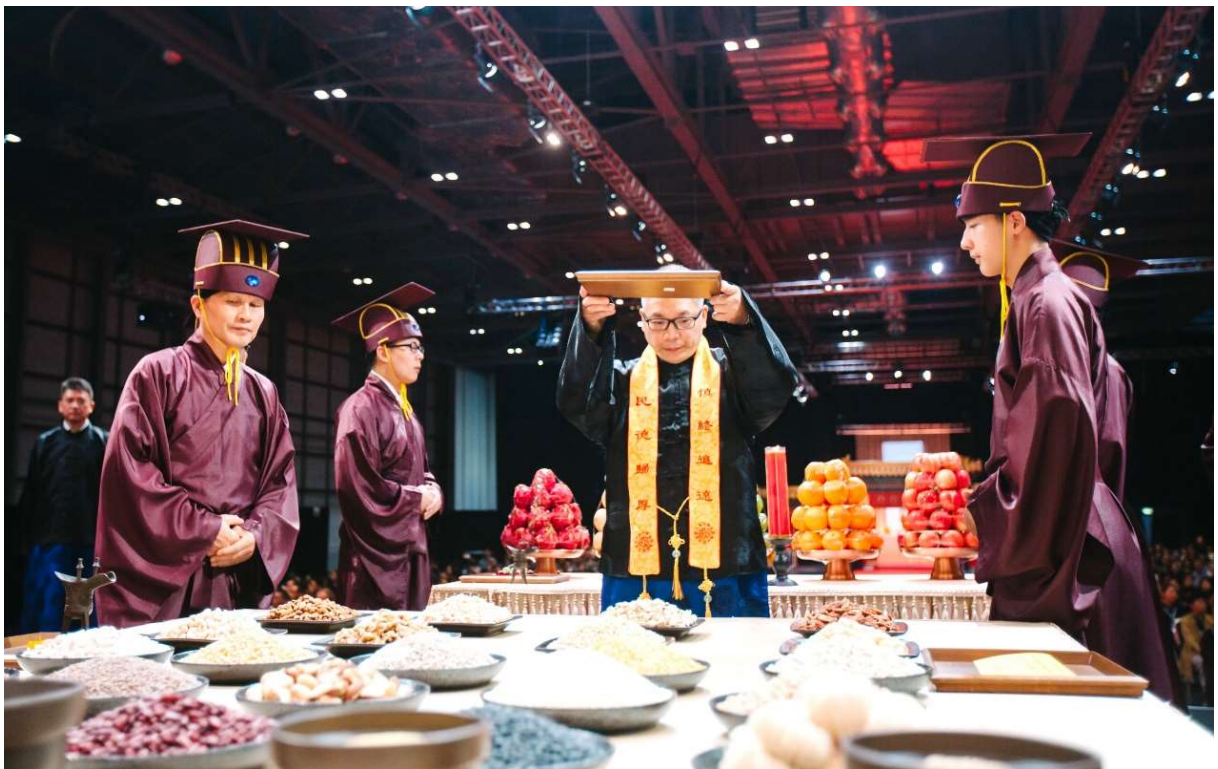
主祭官雙手接帛盤，行獻帛禮。(15)