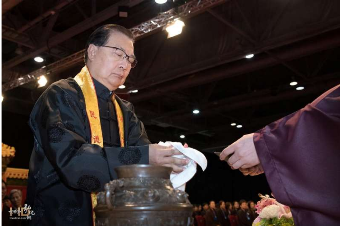
盥洗畢主祭官擦手（8）