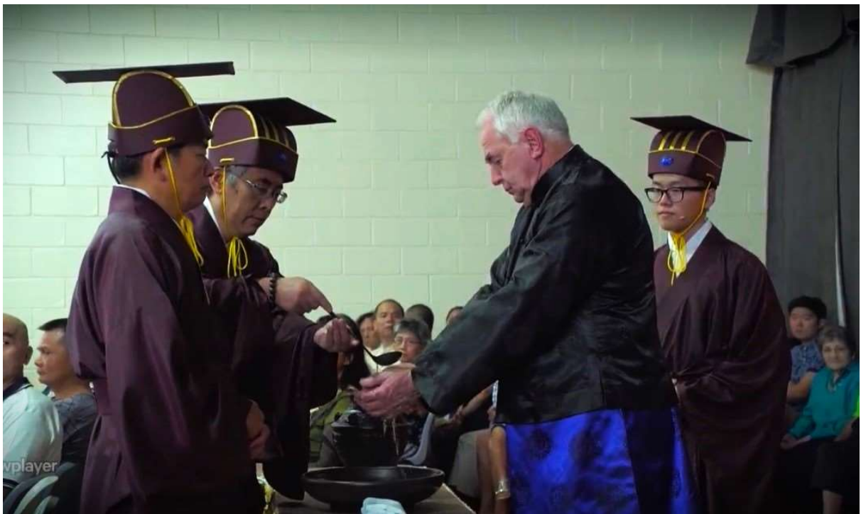
主祭官至盥洗所盥洗 (8)