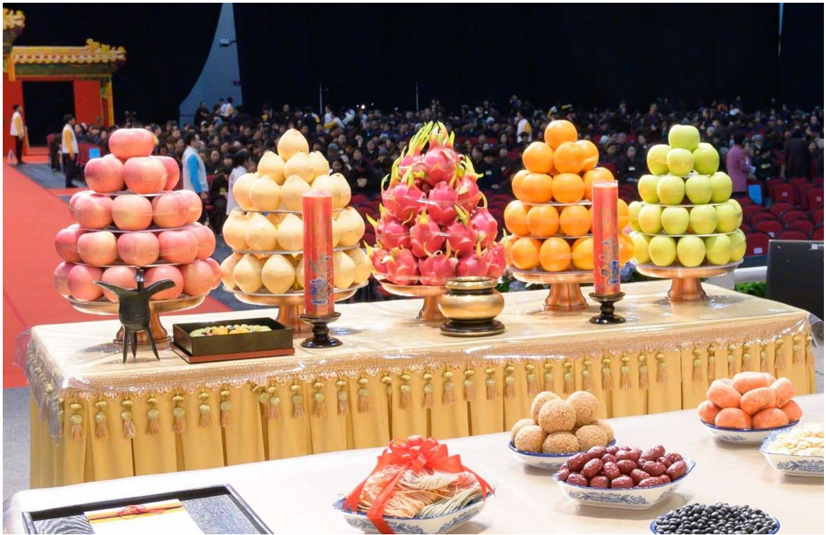
飲福受果前福酒福果置香案右後方 (20)