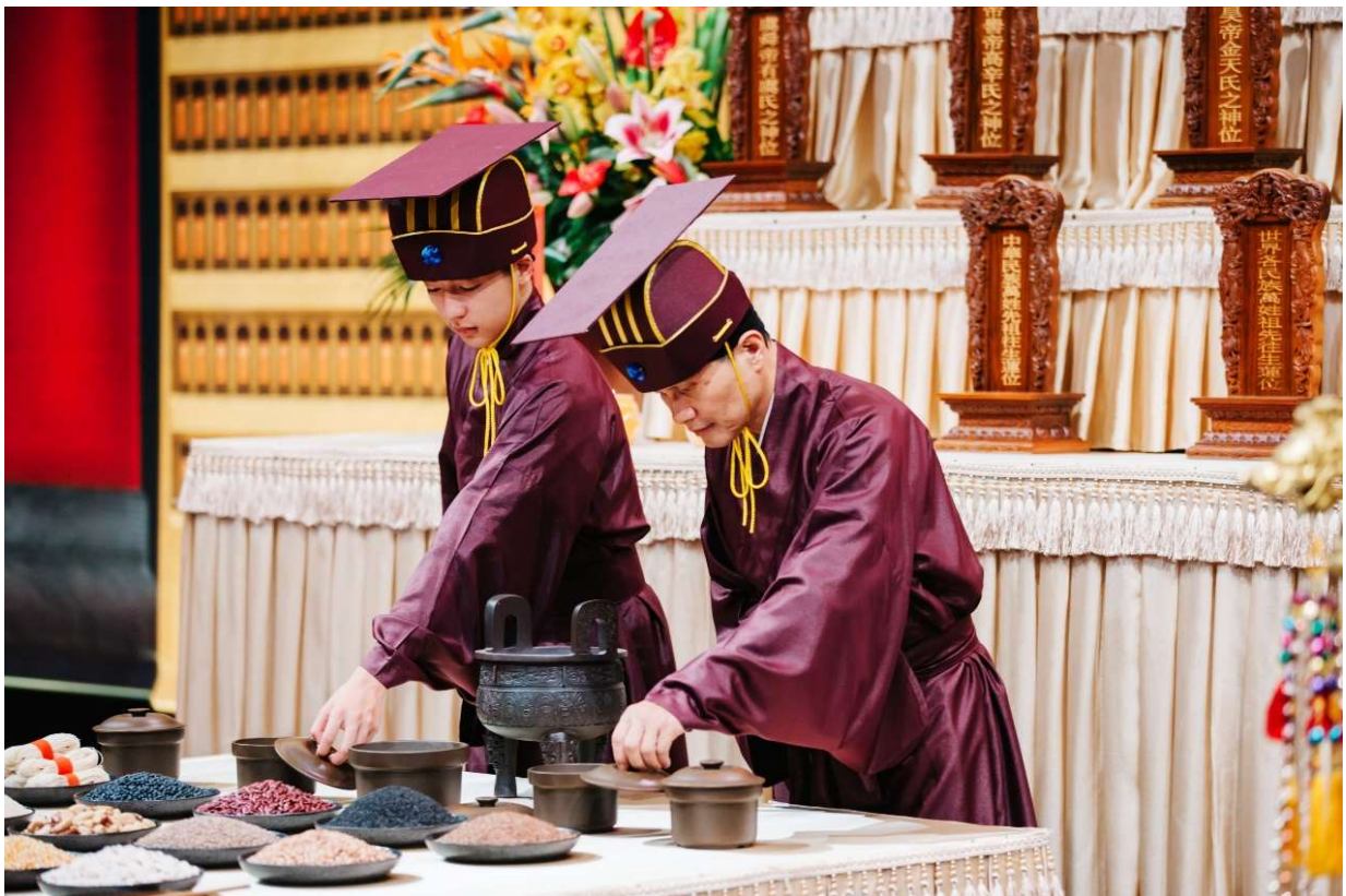
執事禮生聞進饌聲後進饌，進畢，退回原位。(13)