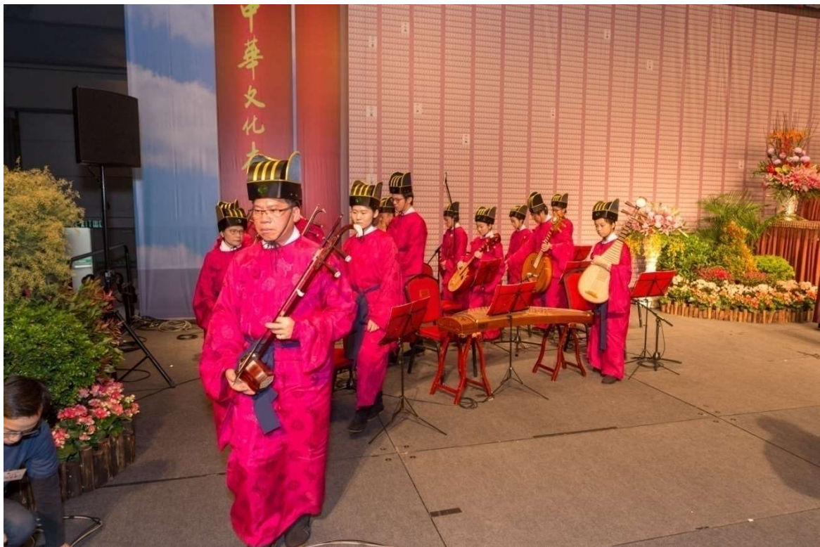
樂生出左腳隨鼓聲一聲一步往外撤班 (28)