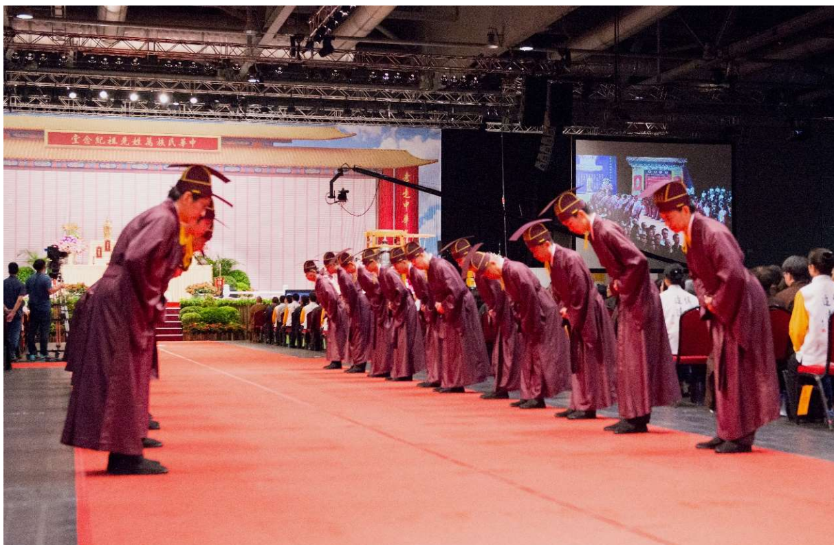
鼓聲第二響全體禮生彎腰鞠躬 (5)