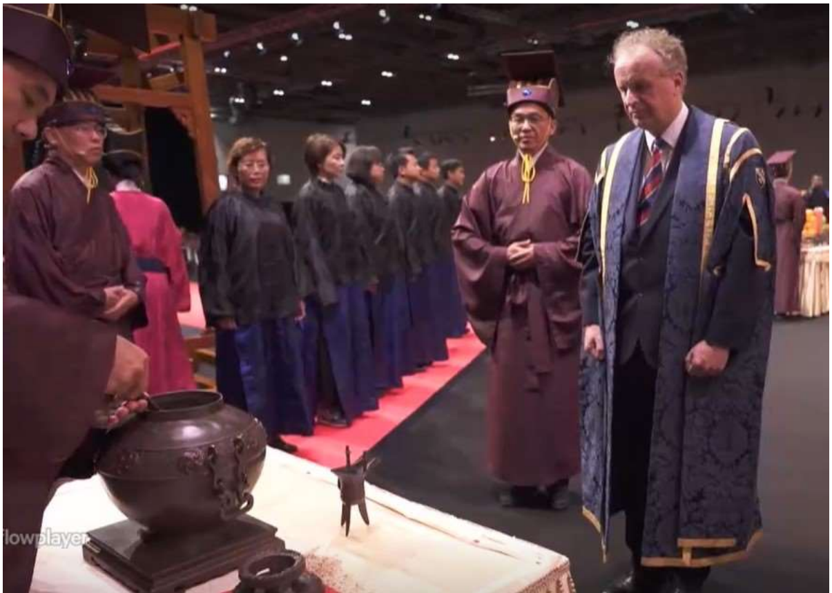
引導主祭官詣酒罇所前 (15)