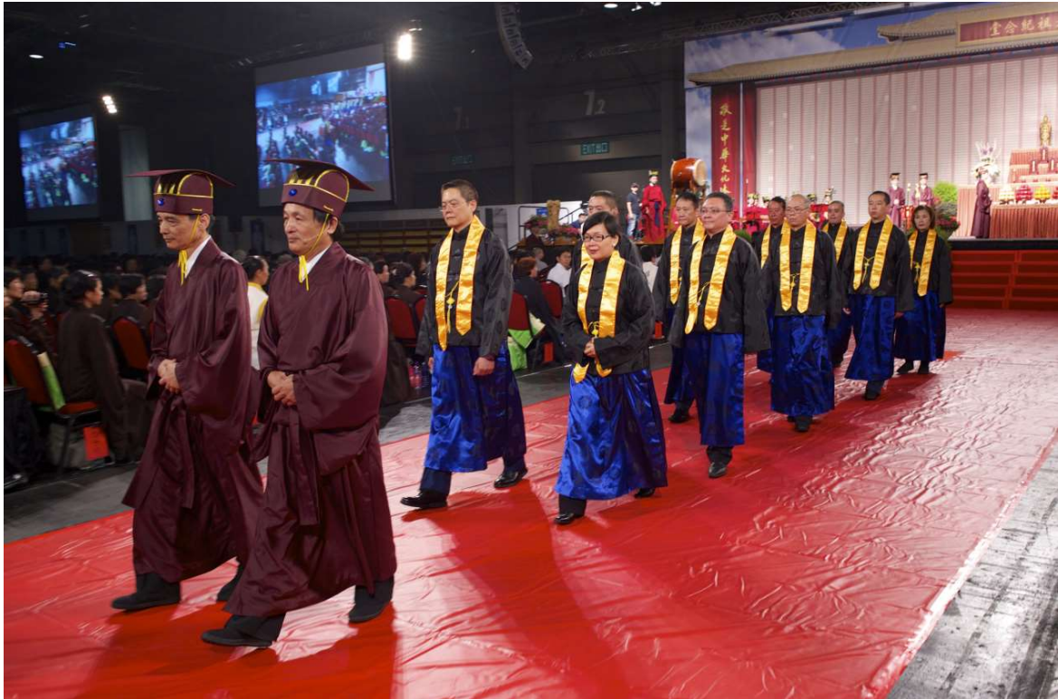
陪祭官以末後先行方式隨主祭官出班。(28)