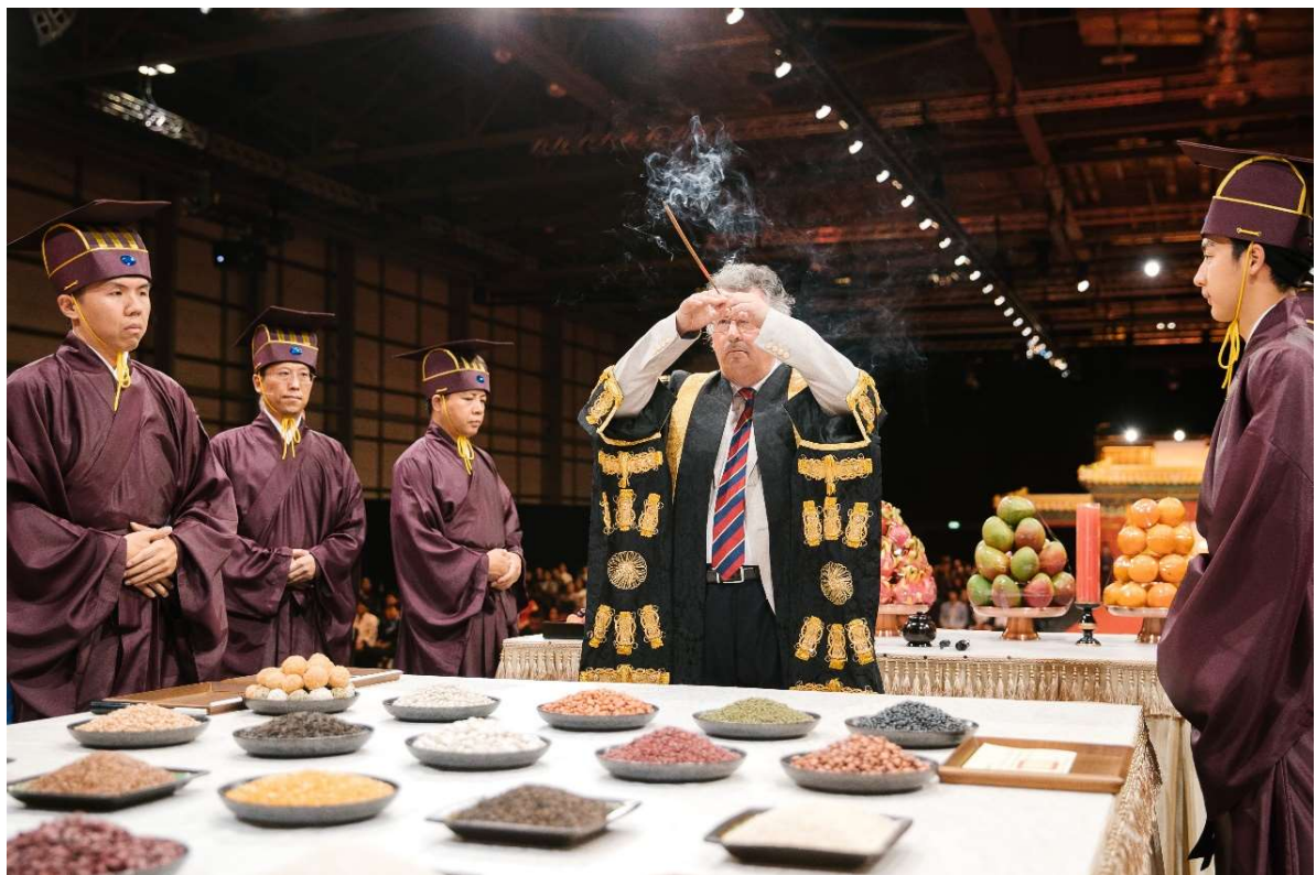
主祭官詣神位前上香 (14)