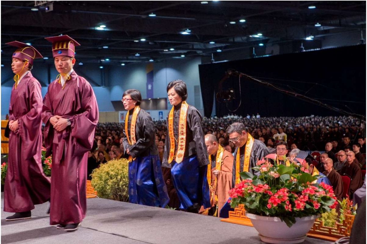
引贊引導陪祭官上台就位 (14)