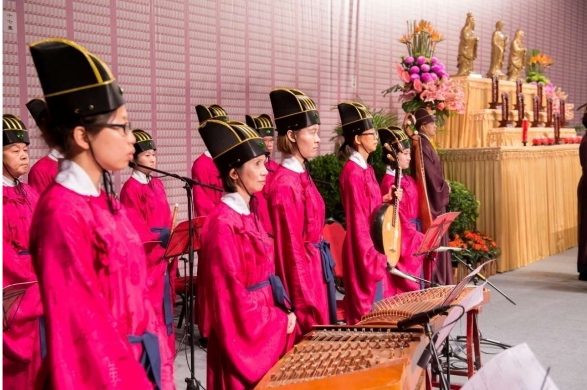
鼓聲一響稍頓，禮生樂生肅立，並朝入班反方向轉身，立正。(28)