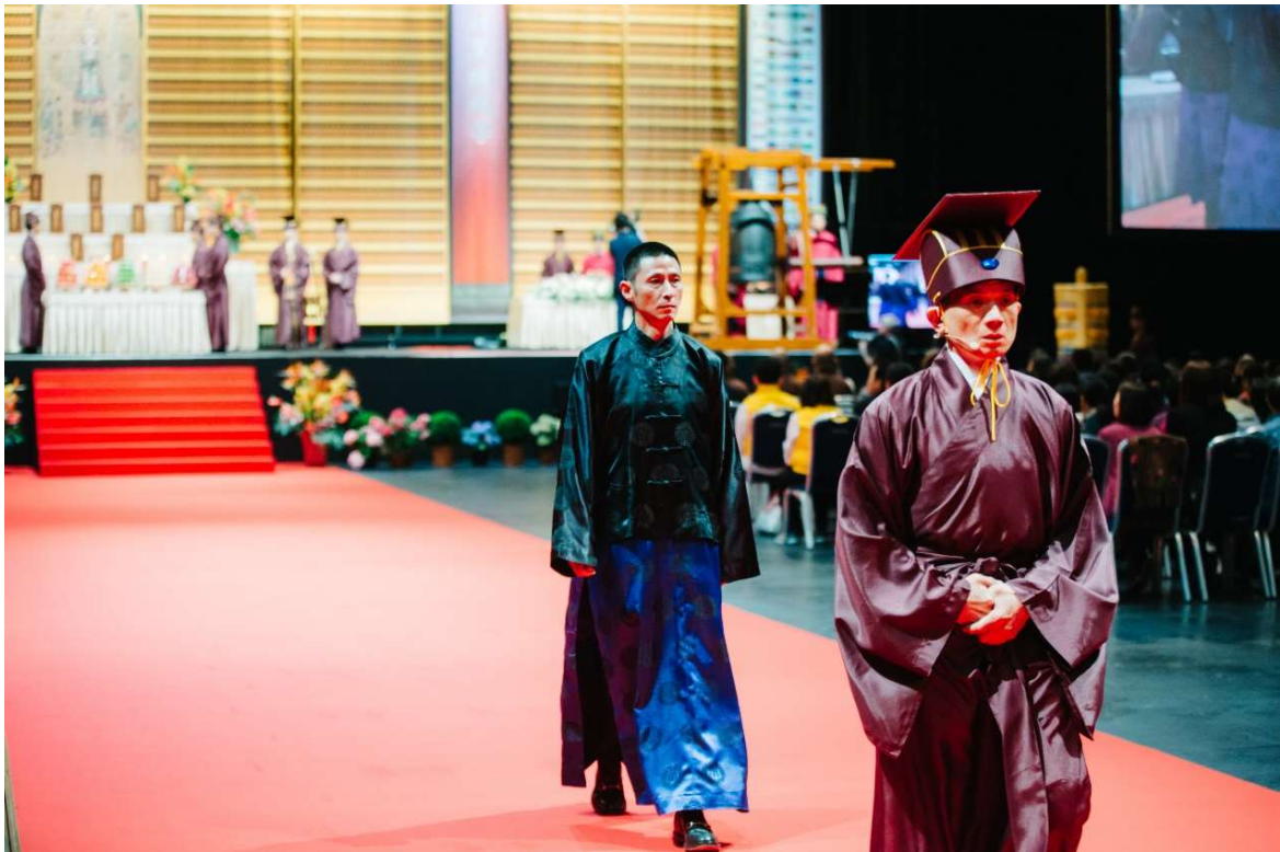
監禮官由引贊引導隨後撤班。(28)