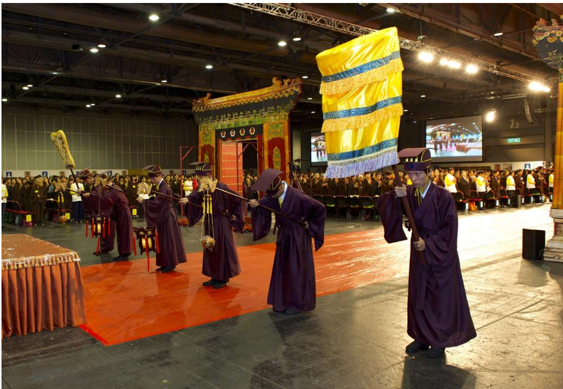
向外三鞠躬，再往內向後轉身，由通道中間進入復位。(11)