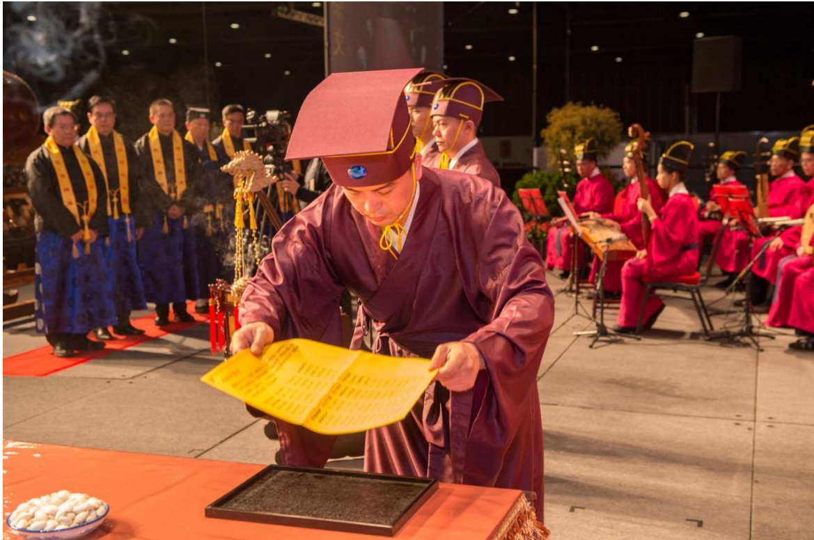
讀祝生聞「全體肅立」時取預置供桌左側祭祖文（16）