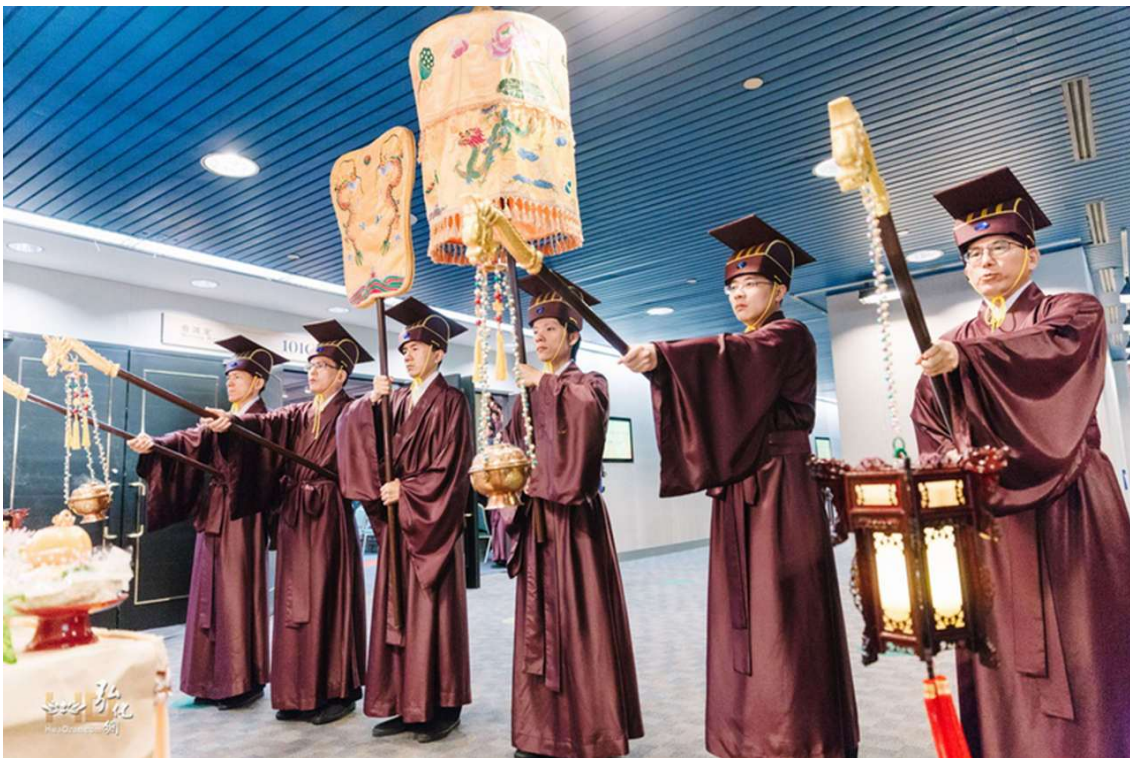
在門外左右轉自側至中橫排一列 (22)