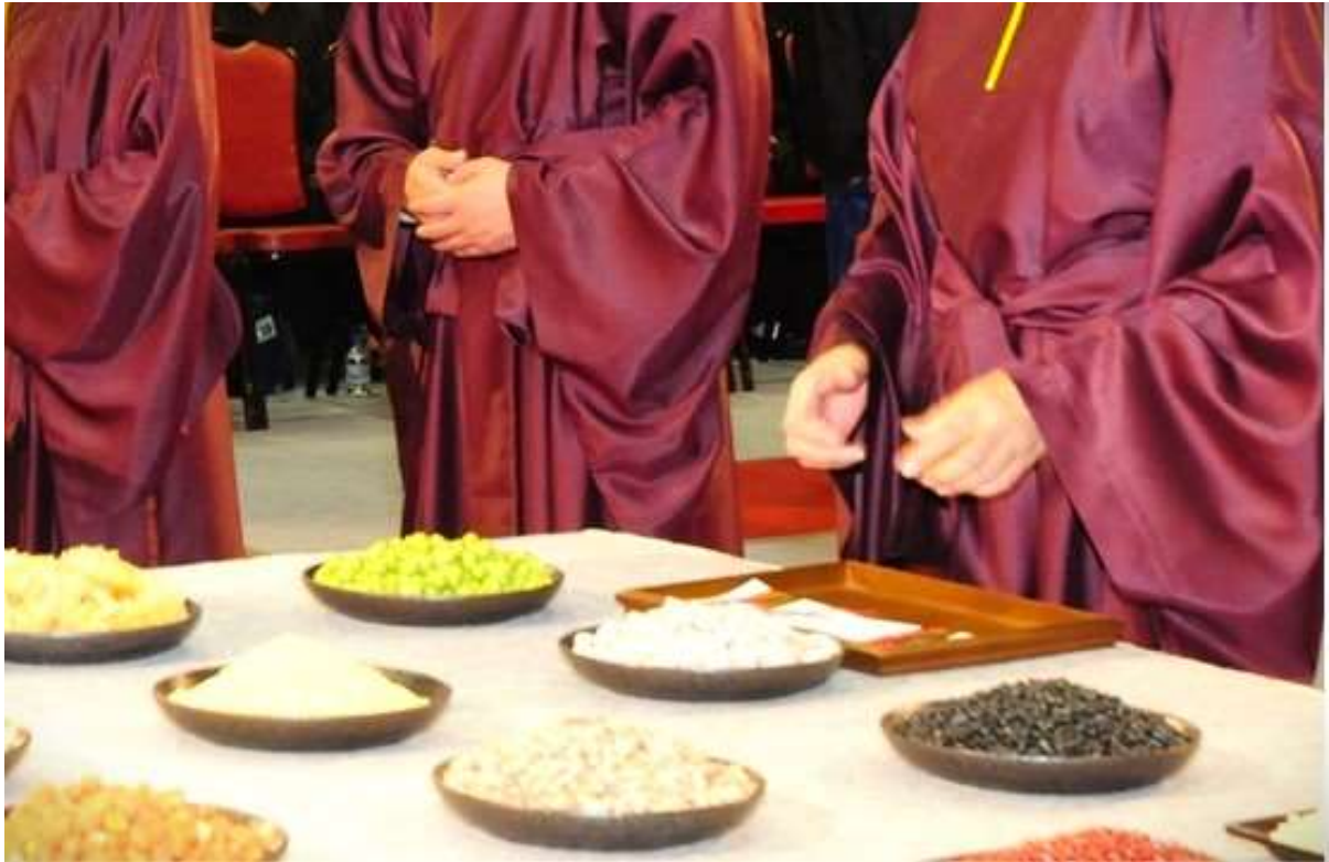
獻帛畢，左禮生接回置供桌左。(15)