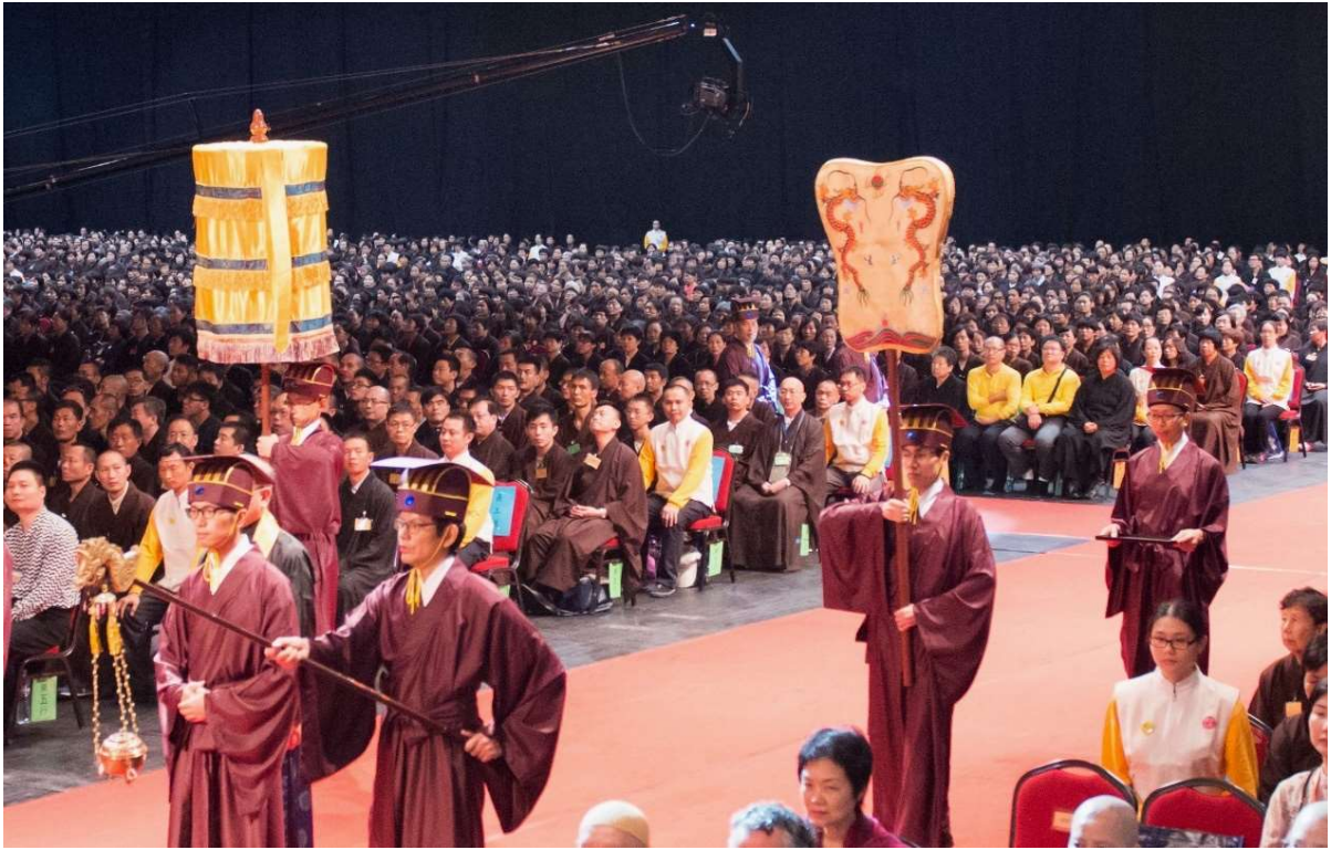
待復位時隨扇生復位 (24)