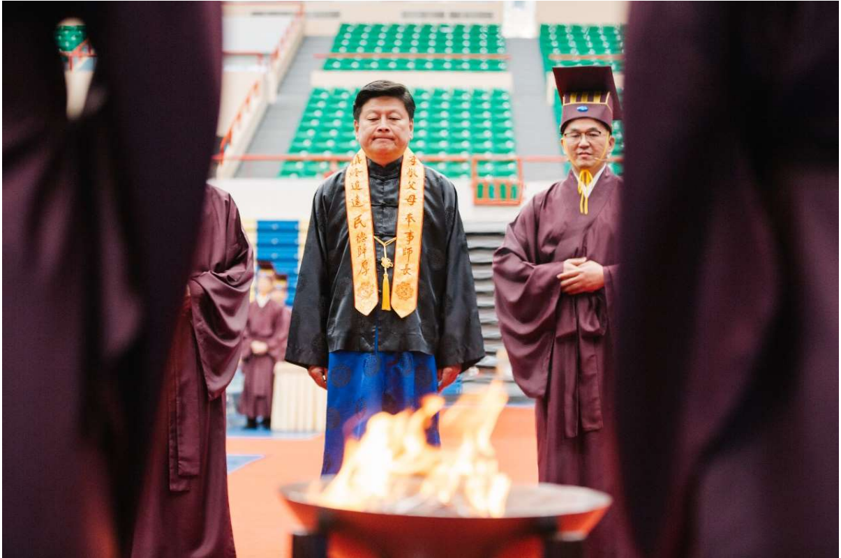
引贊並引導主祭官至燎所，以至誠心完成致祭及送神程序。(25)