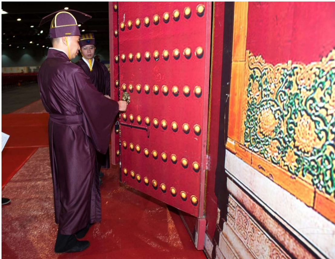
左右禮生同時向中走，近門環時轉身面大門，雙手握門環，以後退方式，把尚在關閉之大門一一拉開。（9）